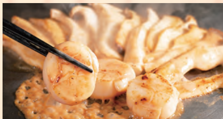
ホタテとエリンギの オイスターマヨ焼き 税込 ¥930