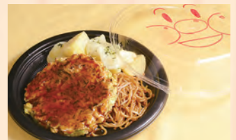
お子様セット 税込 ¥830 お好み焼/焼きそば/じゃがチーズ