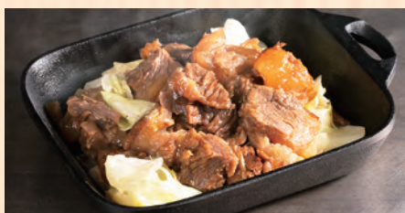
牛すじ塩キャベツ 税込 ¥780