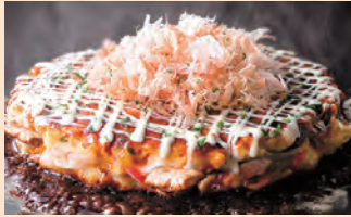
自慢のミックス焼き 豚/えび/いか 税込 ¥1,430