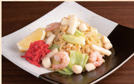
海鮮塩焼きそば～レモン添え～ えび/いか/貝柱 税込 ¥1,280