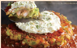
タルタルたっぷりえび焼き 税込 ¥1,080