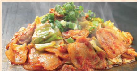
旨辛!豚キムチ～にんにくマシ～ 税込 ¥580