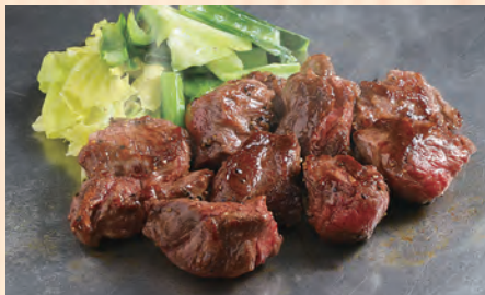
オーストラリア産 角切りビーフ ステーキ(150g) 税込 ¥1,580

※肉の重量はすべて調理前のものです。※焼き加減はミディアムでご提供いたします。レアでの調理は実施しておりません。