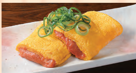
自家製明太子の出汁巻き玉子 税込 ¥760