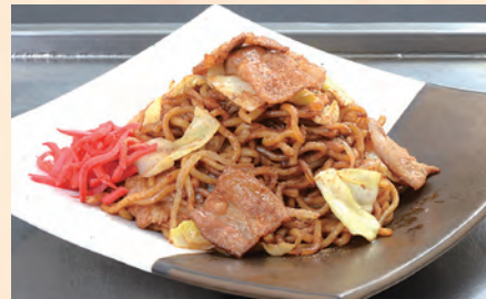
豚焼きそば 税込 ¥1,080