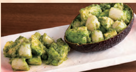
アボカドと貝柱のWASABIバジル ※カシューナッツ使用 税込 ¥680