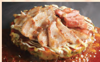
豚三昧焼き 豚バラ/豚トロ/ベーコン 税込 ¥1,300