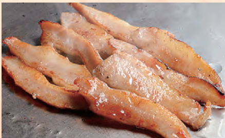
豚トロ(100g) 税込 ¥780