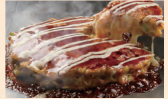
チーズの明太ミルフィーユ焼き 税込 ¥1,300