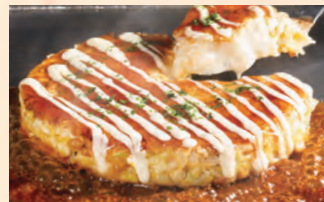
まるごとカマンベールの ミルフィーユ焼き 税込 ¥1,630