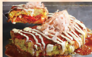
豚たっぷりキムチ ミルフィーユ焼き 税込 ¥1,180