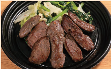
牛ハラミステーキ(150g) 税込 ¥1,380