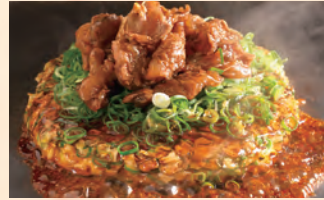
牛すじ葱焼き 税込 ¥1,530