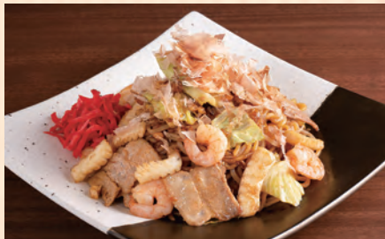
ミックス焼きそば 豚/えび/いか 税込 ¥1,300