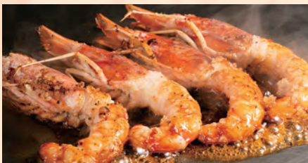
鉄板!ガーリックシュリンプ ～天然赤海老使用～ 税込 ¥980