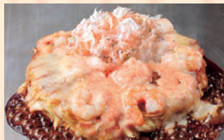
えび明太マヨのチーズ焼き 税込 ¥1,430