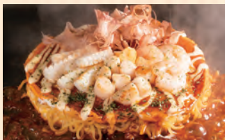
海鮮モダン焼き えび/いか/貝柱 税込 ¥1,580