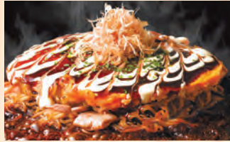
豚たっぷりモダン焼き 税込 ¥1,200