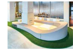
ハイハイスペース