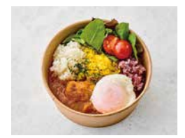
三色ご飯のてんくうチキンカレー (ポーチドエッグトッピング)