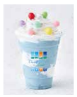
てんくうスムージー