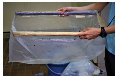
お手製 タチウオ用3Lビニダモ

サンシャイン水族館では生き物の取り上げなどで欠かせないアイテムであるビニール製の道具（通称：ビニダモ）を、タチウオの大きな体に合わせてBIGサイズに！採集の際はこのビニダモを数多く準備して向かいます。