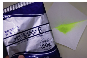
傷の炎症を防止・消毒するための薬剤

また輸送車の水槽は車の揺れによる水の跳ね返りを防ぐためできるだけ水をいっぱいこし、車道は溝のないレーンや段差の少ない道を選び細心の注意を払って輸送します。こうして沼津からだサンシャイン水族館まで約2～3時間を移動して採集が完了となります。